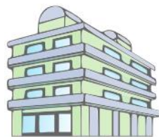
介護老人保健施設